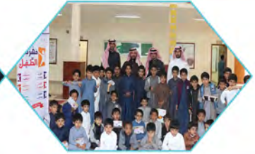
مدرسة تحفيظ القرآن الكريم