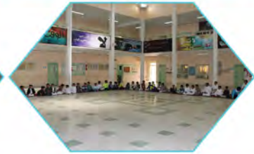
مدرسة عبد الملك بن مروان