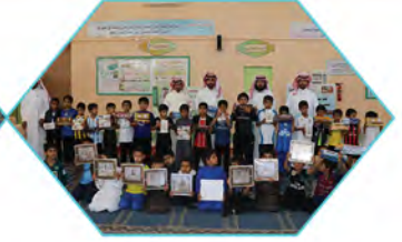
مدرسة عمار بن ياسر الابتدائية